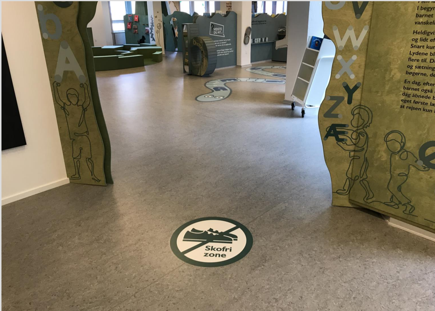
Et skofrit børnebibliotek er et plus for de besøgende, der sætter stor pris på, at det er lækkert og rent