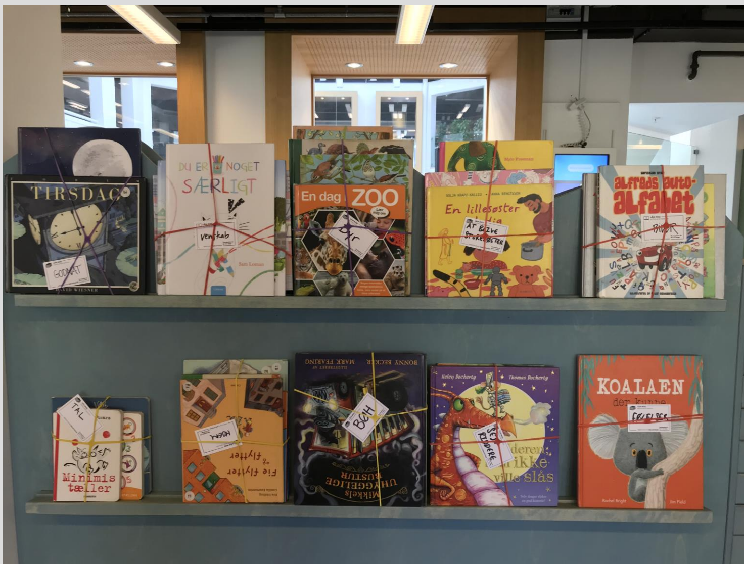
Det er bogudstillinger som denne – med forsiderne udad - der er med til at inspirere børn til at interagere med bøgerne